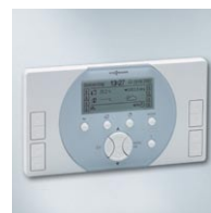
Vitohome 300 – pełne zarządzanie ciepłem w pomieszczeniach Państwa domu