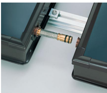
Kolektory łatwo łączy się dzięki systemowi połączeń wtykowych ze stali nierdzewnej